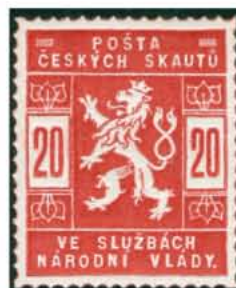
20 h červená