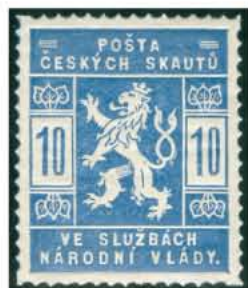
10 h světle modrá*