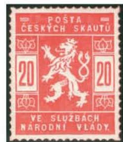
20 h světle červená