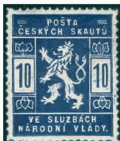
10 h modrá